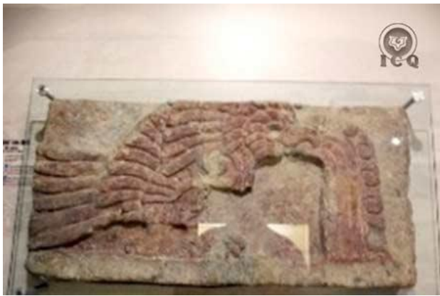
Águila arrojando un chorro de agua por el pico.

Águila: tercer Logos. Agua: la simiente; esta escena nos recuerda que la energía creadora es sagrada y proviene del espíritu santo, trabajando en la transmutación de la simiente es como podemos regresar al padre de todas las luces.