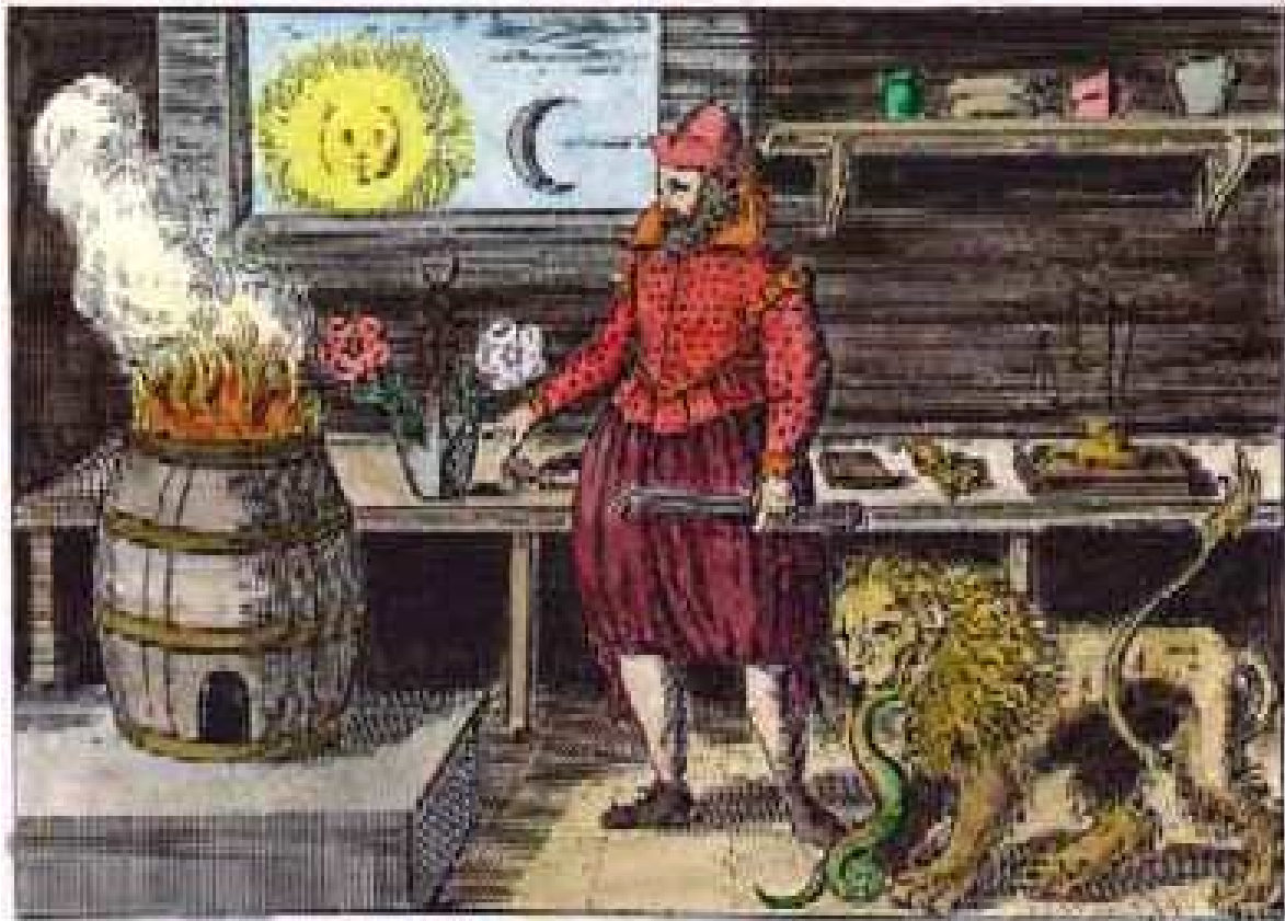
(Doceava Llave de Basilio Valentín)