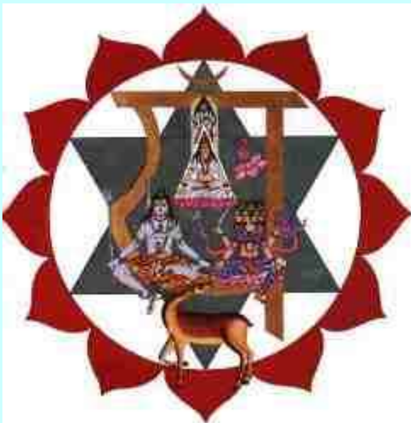
Chakra Anahata o Cardíaco.

Trimestre Abril Mayo Junio. Año 39 de Acuario (2001)