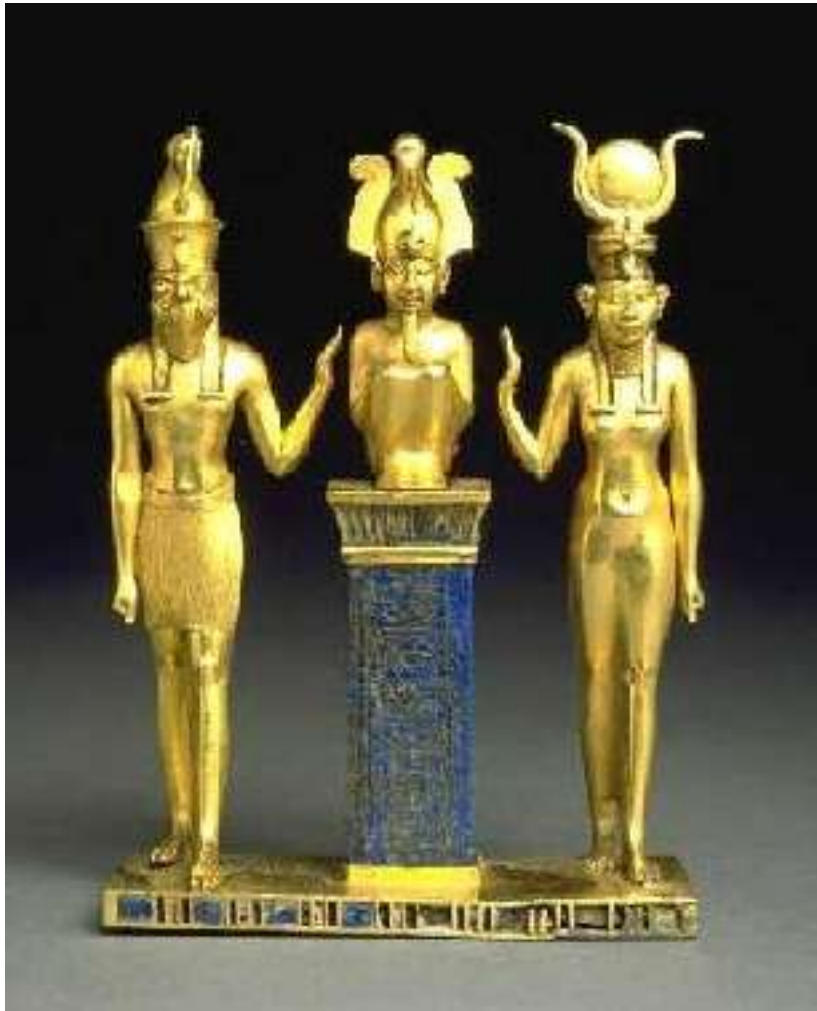
Triada egipcia. Horus Osiris Isis.

Instituto Cultural Quetzalcoatl de Antropología Psicoanalítica, A.C. www.samaelgnosis.net y www.samaelgnosis.org Portal en Inglés: www.samaelgnosis.us