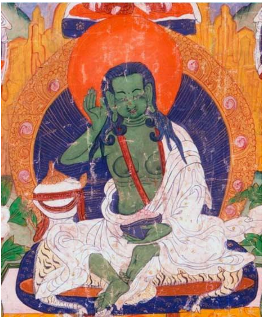
Imagen 2: Milarepa. Anónimo. Siglo XIX.

Imagen 1: Milarepa. Desconocido. Finales siglo XIX.