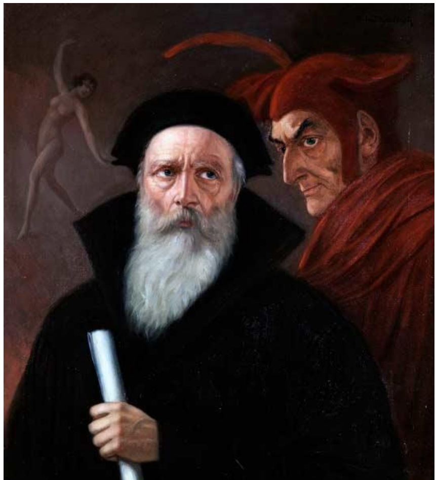
Imagen 2: Fausto y Mefistófeles. Anton Kaulbach Silgo XIX.