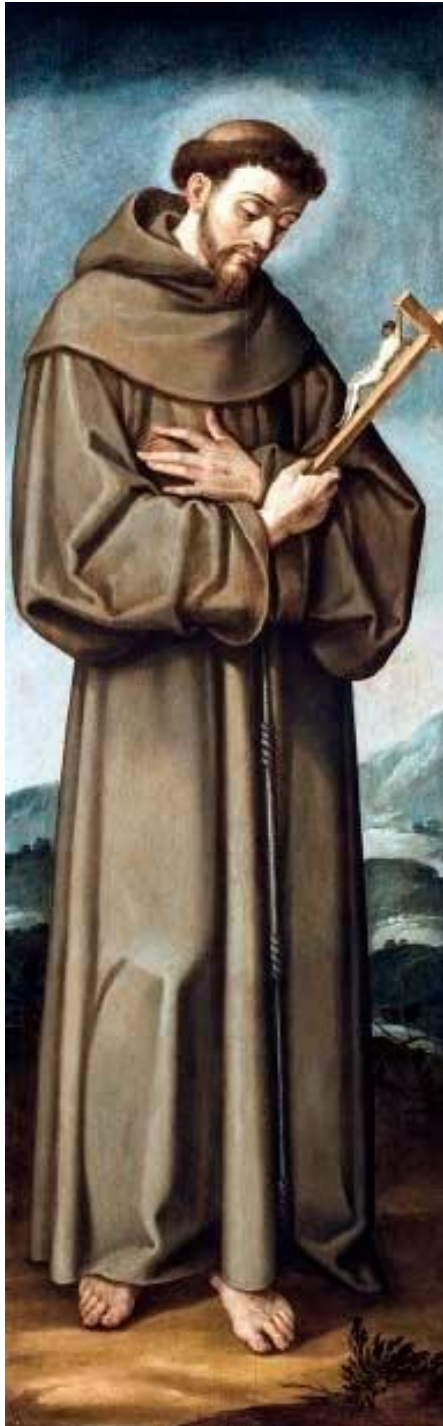
Imagen: San Francisco de Asís. Francisco Pacheco. 1605-1610.